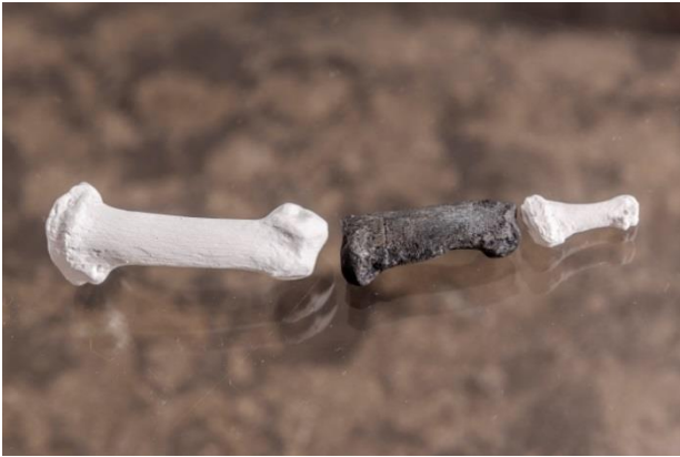
8. Die Großzehe des männlichen Danuvius (weiße Knochen rekonstruiert)